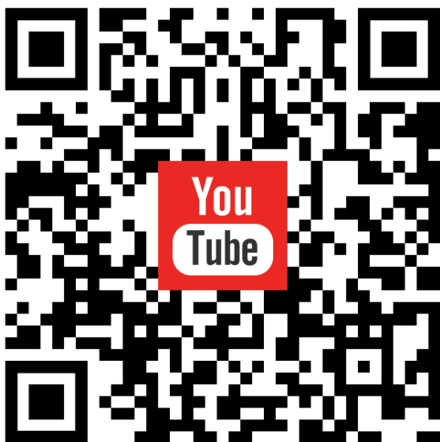
De Zaiers – 'De Postkoets' (1956) [Instr.]